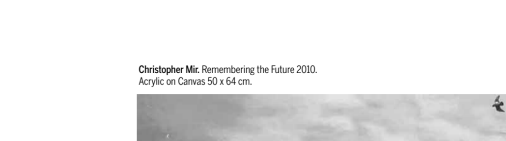
Christopher Mir. Remembering the Future 2010. Acrylic on Canvas 50 x 64 cm.