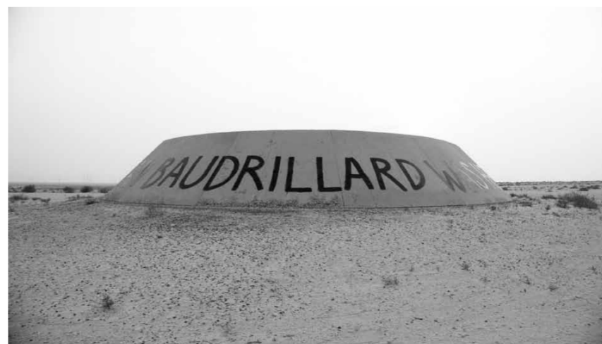
Alia Farid. Jean Baudrillard was here 2010. Photograph 19,05 x 33,71 cm.

CARLES TACHÉ, KOWASA, MASART, HARTMANN, SAFIA, EUDE, FERRAN CANO, H 2 O, N 2 , RAÍÑA LUPA, TRAMA, ALONSO VIDAL, ÀNGELS BARCELONA FIDEL BALAGUER, JOAN GASPAR, MARLBOROUGH BARCELONA, RENÉ METRAS, SENDA, JOAN PRATS, JOAN PRATS - ARTGRÀFIC